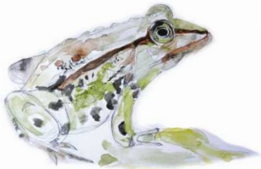
Grenouille verte Illustration : Marianne Biard