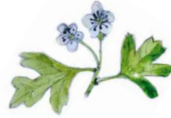
Aubépine monogyne Illustration : Marianne Briard

Rens. et inscription au 05 49 02 33 47 ou sur gerepi@free.fr