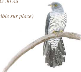
Coucou gris Illustration : Kátia Liponoi

(hébergement et restauration possible sur place)