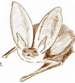
Oreillard gris - Illustration : Nicolas Tranchant