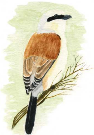
Pie-grièche écorcheur - Illustration - Cécilie Fèvre / LPO