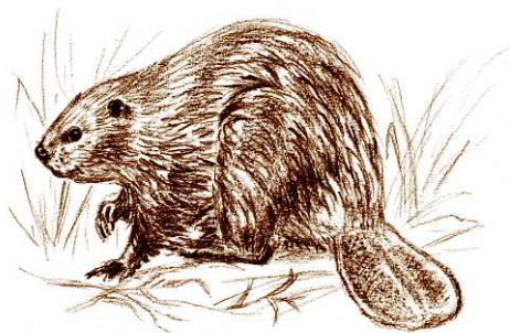
Castor d'Europe - Illustration : Katia Lipovoi

Gratuit. Réservé aux adhérents. Rens. et inscription obligatoire sur www.vienne-nature.asso.fr ou au 05 49 88 99 04.