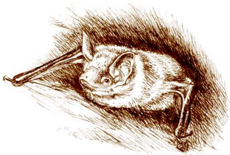
Petit Murin - Illustration : Ivan Escudé

R.-V. sur le parking de la salle polyvalente. Gratuit. Tous publics. Rens. au 06 06 49 89 37 ou vienna@lpo.fr