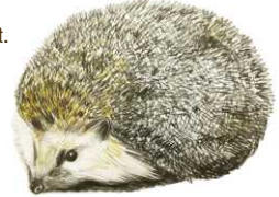
Hérisson commun - Illustration : Marion Jean